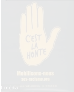
30 000 expulsions par an, c'est la honte! / SOS Racisme.ParisSOS Racisme[-Entre 2007 et 2010]