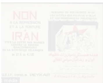
Non à la répression et à la torture en Iran. / Union des étudiants iraniens en France (UEIF). ParisUnion des étudiants iraniens en France (UEIF)1981