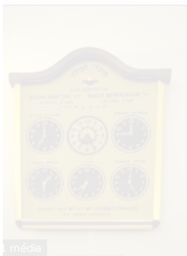
Synagogue - rue Doudeauville