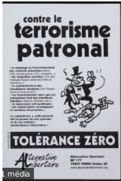
Contre le terrorisme patronal.Paris, FranceAlternative libertaire (AL) (Paris, France), [198- ?].[198-?]