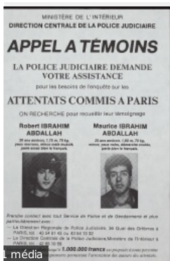
APPEL À TÉMOINS. MINISTÈRE DE L'INTÉRIEUR. DIRECTION CENTRALE DE LA POLICE JUDICIAIRE. ATTENTATS COMMIS À PARIS. ON RECHERCHE pour connaître leur identité...