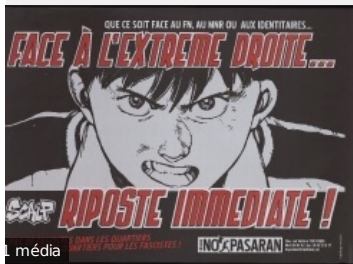
Riposte immédiate !. Coordination nationale antifasciste (CNAF) (Paris, france), [198- ?].[198-?]