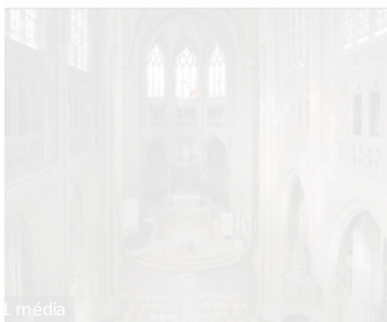
Eglise Saint Bernard